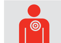
Douleur ou inconfort thoracique