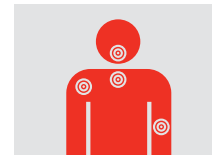
Inconfort à d'autres régions du haut du corps