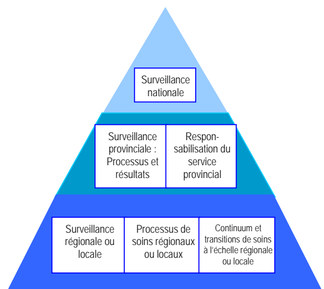
Figure 1 : Hiérarchie des priorités de rendement en matière d'AVC

Ce groupe a créé un cadre de qualité qui permet de déterminer les pratiques exemplaires de soins de l'AVC, les services et les mécanismes de soutien de la